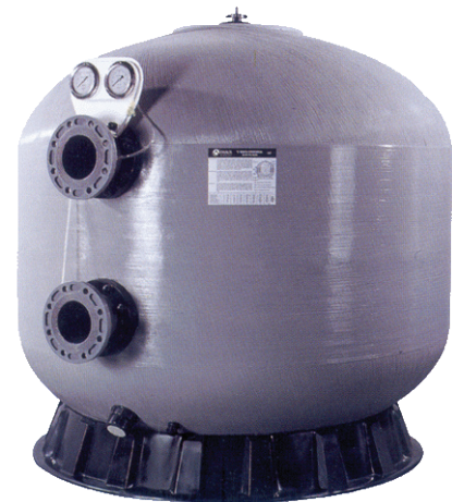
Filtros comerciales Serie “Mediterráneo”